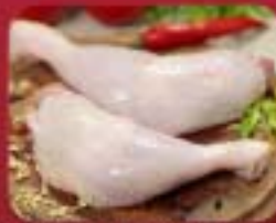
CHICKEN LEG WITH THIGHS