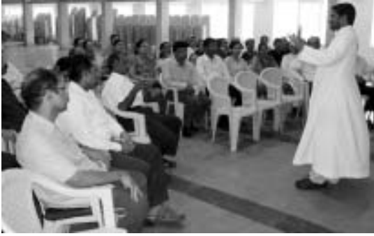
ಎಪಿಸ್ಕೊಪಲ್ ಸಿಟಿ ವಾರಾಡೊ