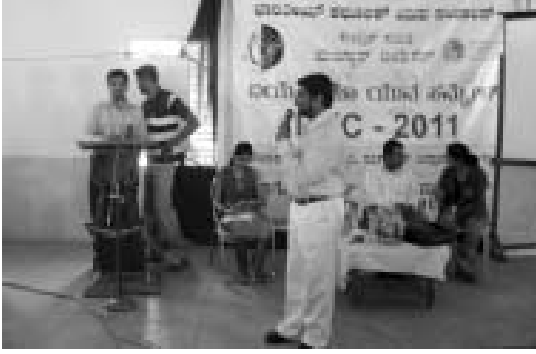
ಯುವ ಸಮ್ಮೇಳ, ಬೆಳ್ತಂಗಡಿ